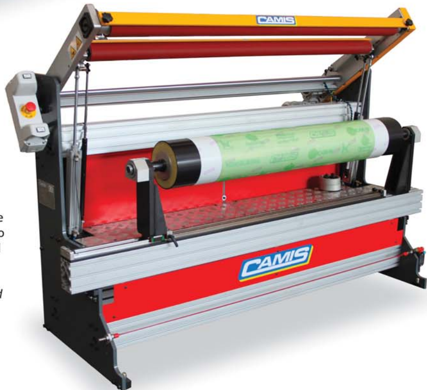
Plate demounting and tape application in one device, designed to enhance the productivity of the flexo pre-press department.

Smontaggio cliché e applicazione biadesivo in un dispositivo, creato per aumentare la produttività del reparto pre-stampa.